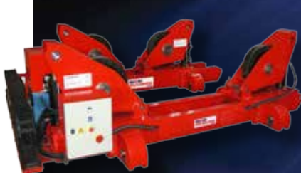
Drehvorrichtungen auf Schienenfahrwerke

Drehvorrichtungen selbstausrichtend, Drehvorrichtungen herstellbar, Drehvorrichtungen auf Schienenfahrwerke, Fit Up Bed Drehvorrichtungen, Anti-Drift System, Drehvorrichtungen für spezielle Anwendungen