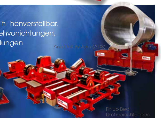
Anti-Drift System (ADS)